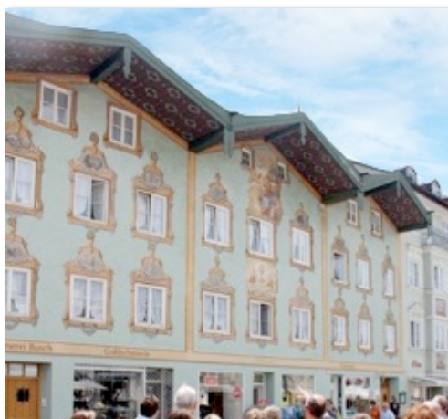
Auch bei dem Höflinghaus, Marktstraße 10/12/14, hat Gabriel von Seidl aus hier drei Gebäuden einen einheitlichen Baukörper geschaffen, durch eine einheitliche Fassadengestaltung und Dachunterseitenbemalung.