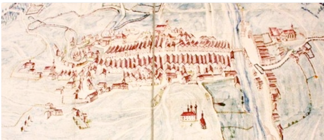
Detail einer Karte von 1793: Burgfrieden Tölz – augenfälligst die Geschlossenheit der Marktstraße