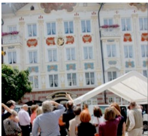
Ein Teil der Gruppe vor dem Stadtmuseum, ehem. Rathaus, Marktstr. 48: Der für die Tölzer Marktstraße typische Doppelgiebel ist das Ergebnis Gabriel von Seidls Umgestaltung 1903/04 zweier ursprünglich traufseitig ausgerichteter Gebäude.