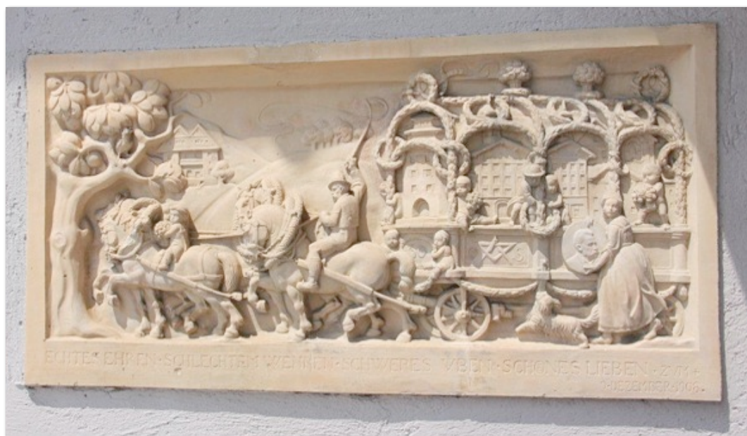
Steinrelief zu Seidls 60. Geburtstag an der Fassade des Tölzer Kuriers Die Inschrift lautet: "Echtes ehren, Schlechtes wehren, Schweres üben, Schönes lieben zum 9. Dezember 1906"